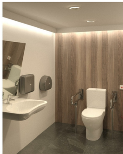
3 Aseo PMR - render 3 2.2